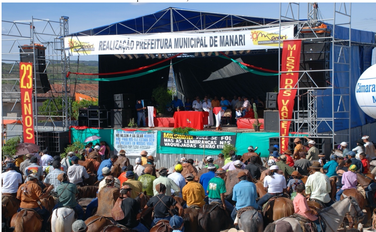
FOTOGRAFIA 08: Vaqueiros acompanham a celebração da 23ª edição da Missa do Vaqueiro na atual Praça de Eventos, situada na Avenida JK.