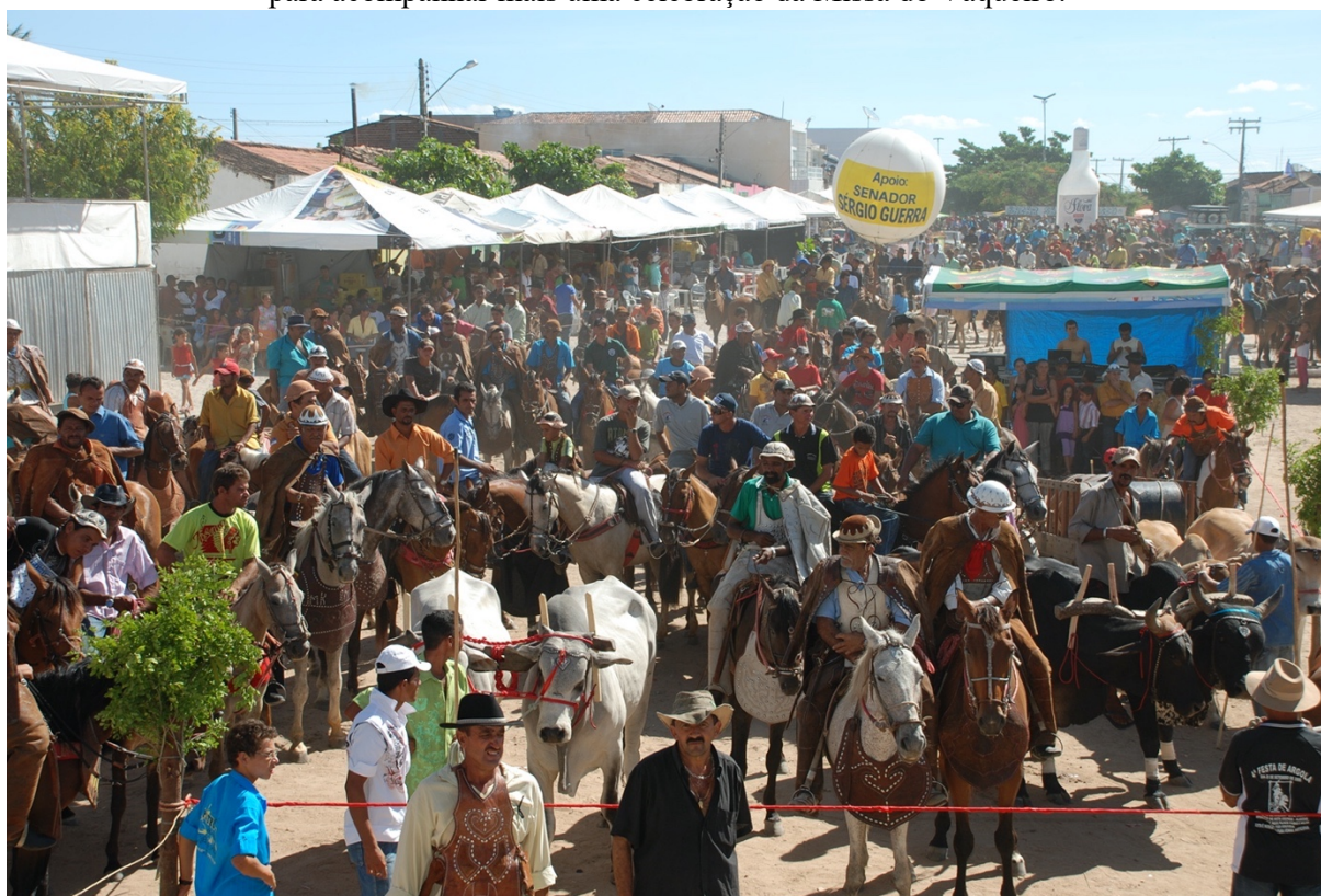
FOTOGRAFIA 10: Vaqueiros, turistas e munícipes dividem o mesmo espaço da Praça de Eventos para acompanhar mais uma celebração da Missa do Vaqueiro.

Fonte: Acervo particular do fotógrafo George Pessoa. 2009.