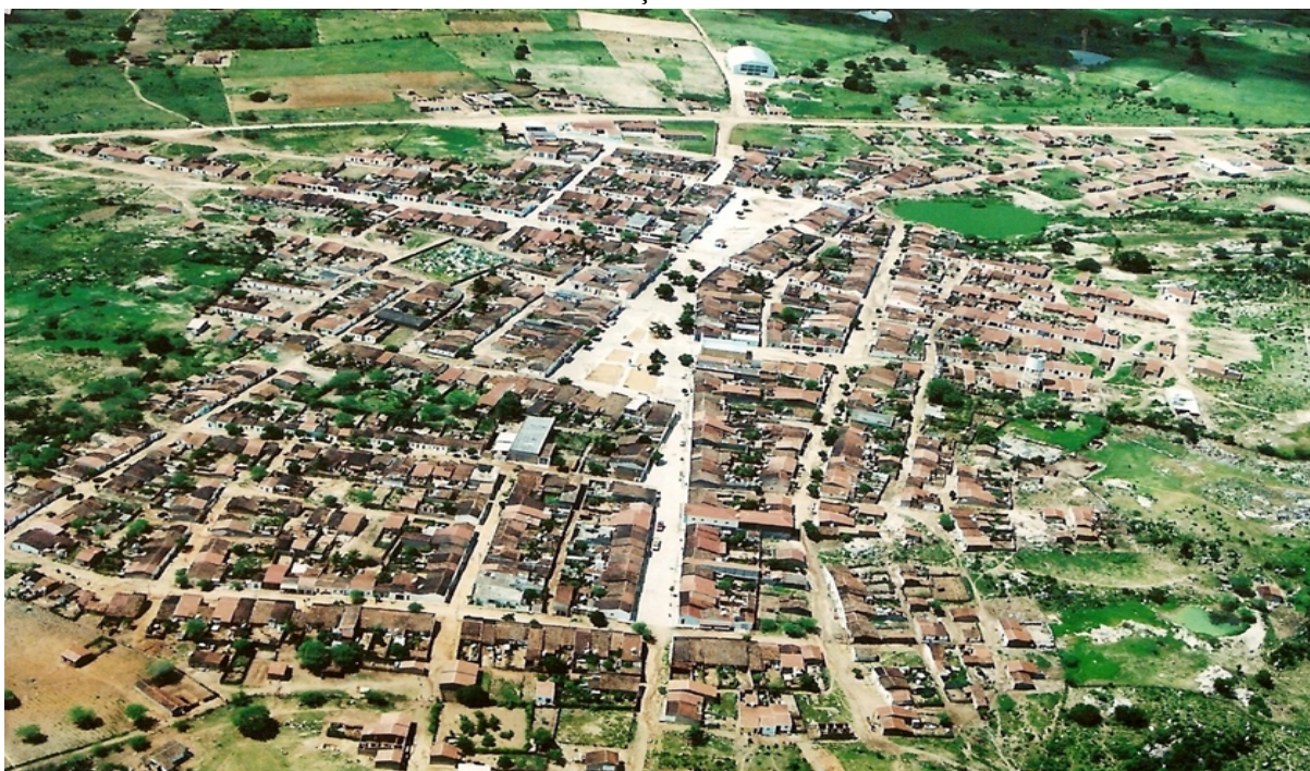
FOTOGRAFIA 01: Vista aérea do traçado urbano do distrito sede. Manari – PE.