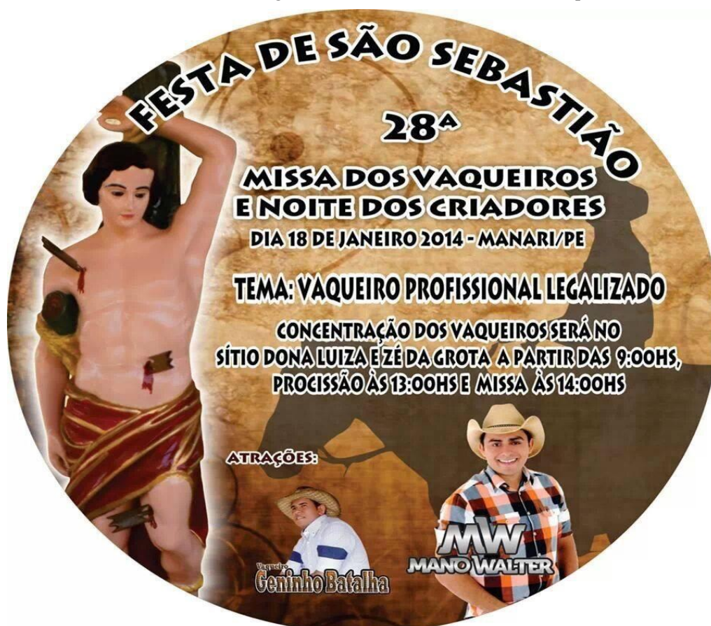
IMAGEM 04: Adesivo de divulgação da 28ª edição da Missa do Vaqueiro de Manari.