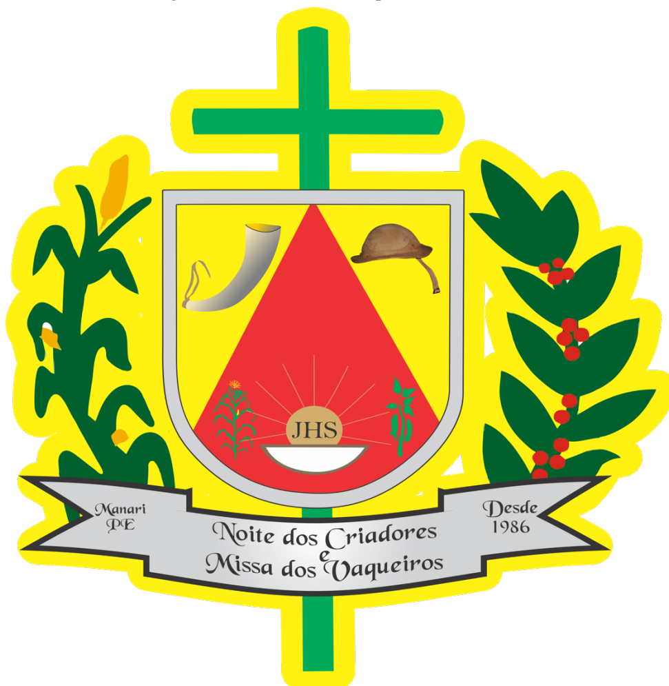
IMAGEM 05: Brasão/logomarca da Missa do Vaqueiro e da Noite dos Criadores de Manari.