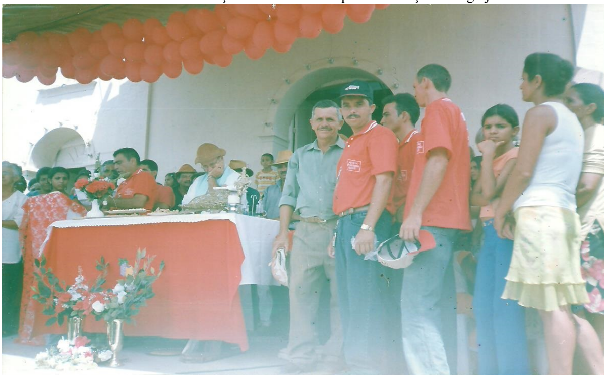
FOTOGRAFIA 04: Celebração da Missa do Vaqueiro na calçada da Igreja Matriz.