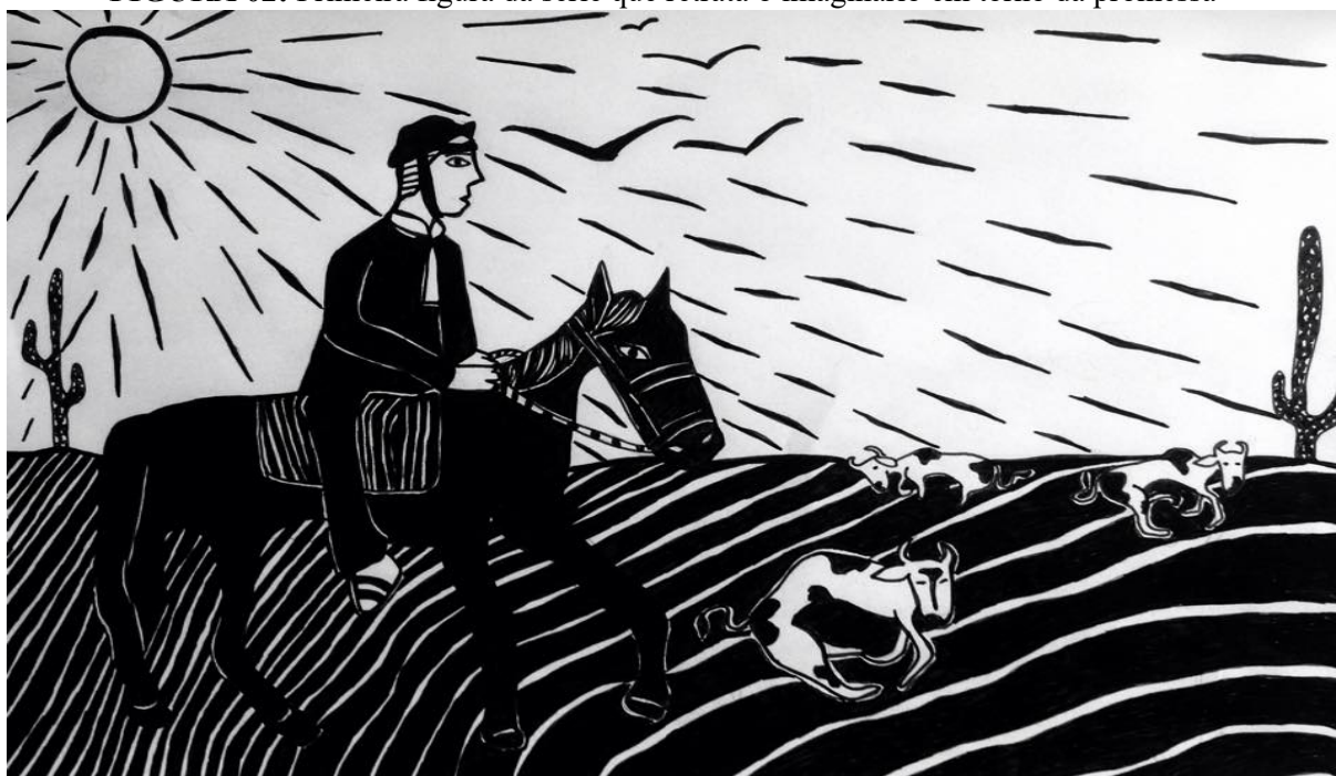
FIGURA 02: Primeira figura da série que retrata o imaginário em torno da promessa