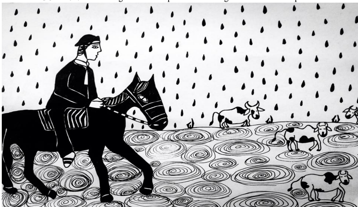
FIGURA 04: Terceira figura da série que retrata o imaginário em torno da promessa.