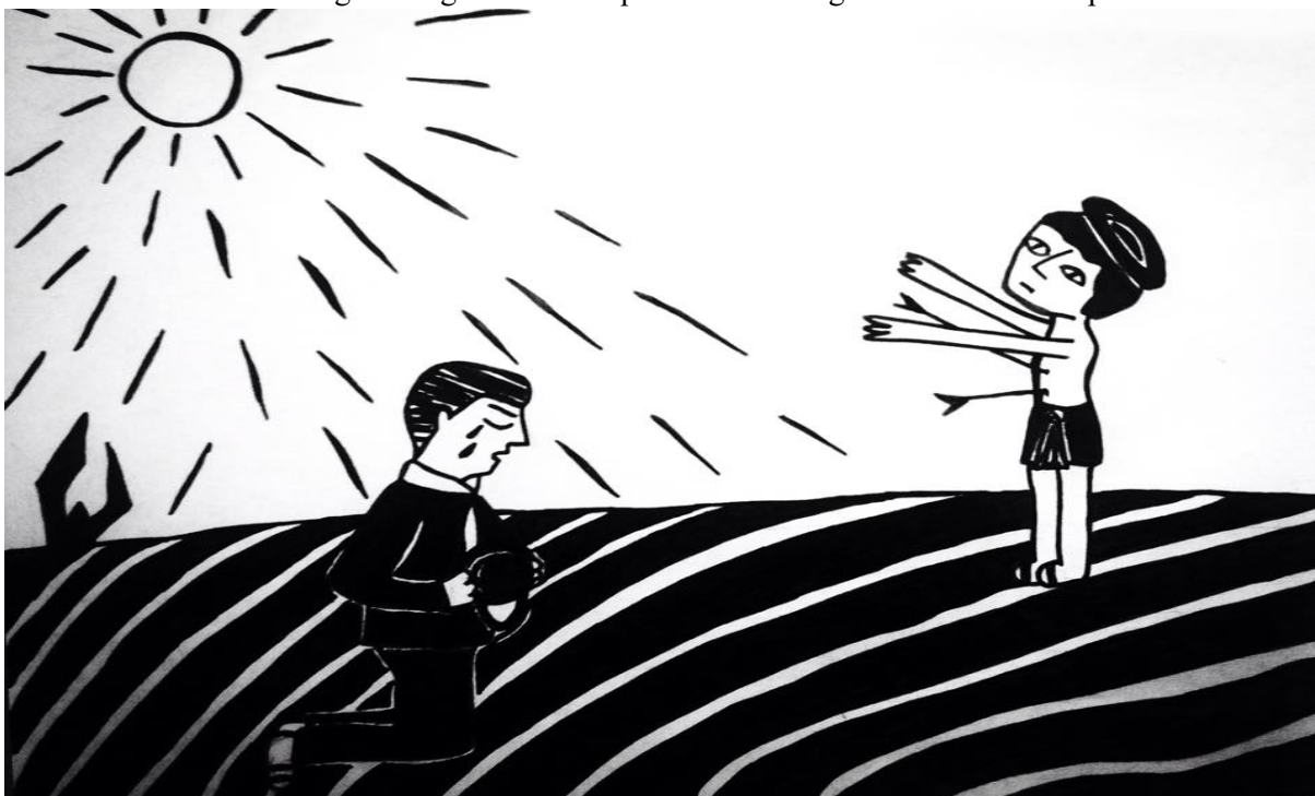
FIGURA 03: Segunda figura da série que retrata o imaginário em torno da promessa