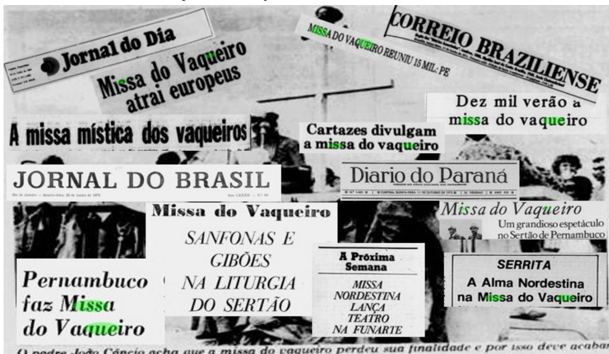
FIGURA 01: Compilação com títulos de matérias jornalísticas sobre a Missa do Vaqueiro de Serrita publicada em jornais do DF, RJ, PR e MT.