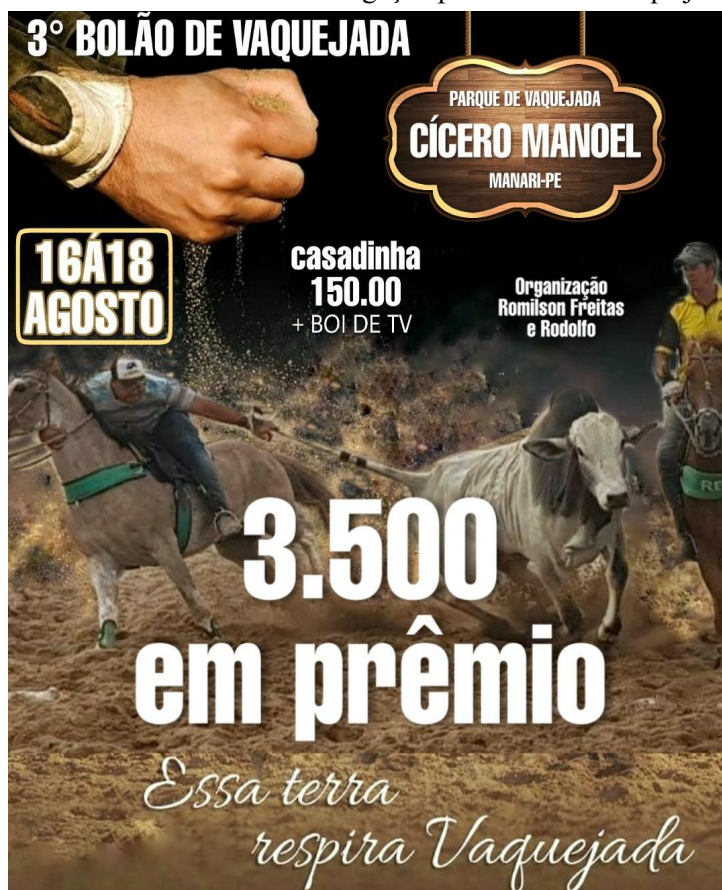
IMAGEM 01: Cartaz de divulgação para Bolão de Vaquejada.