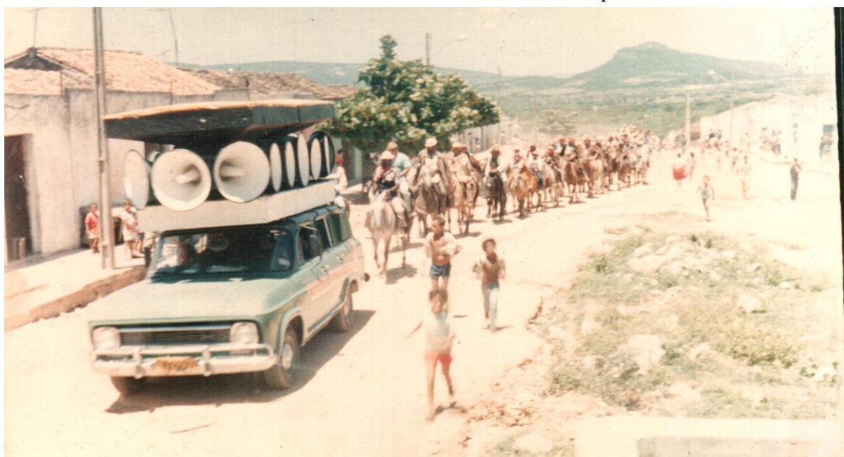
FOTOGRAFIA 06: Procissão da Missa do Vaqueiro.