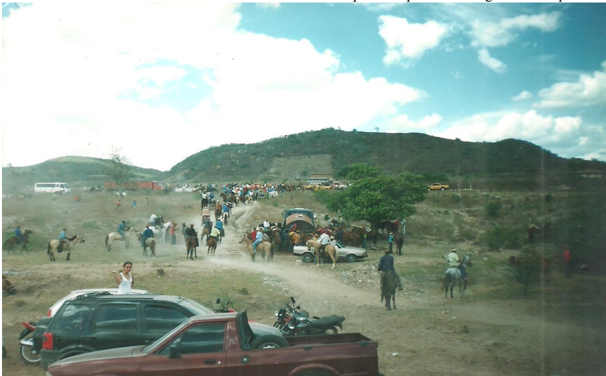
FOTOGRAFIA 05: O sítio Velho Matias é transformado para recepcionar a chegada dos vaqueiros.