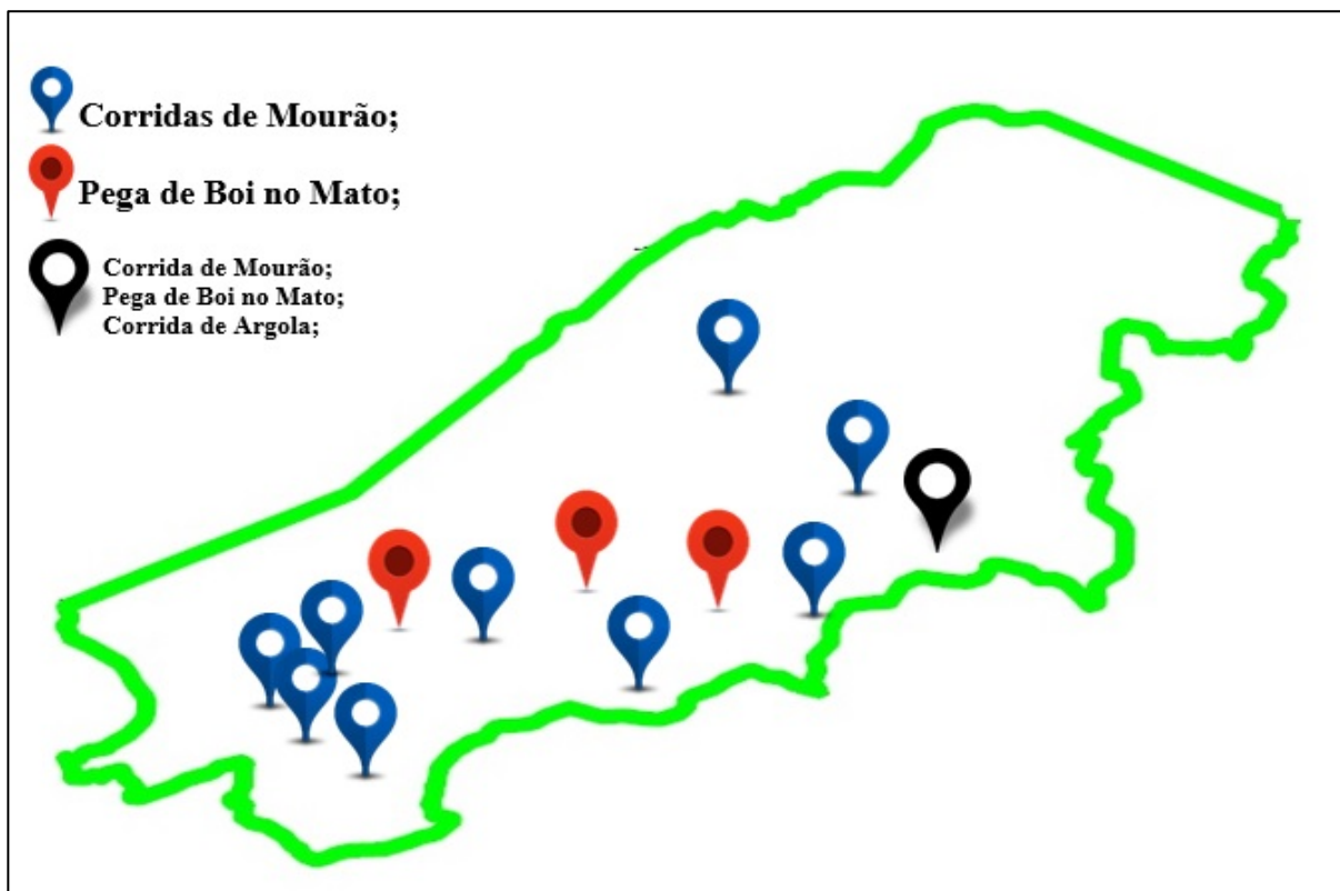
MAPA 01: Identificação e localização das Festas de Gado no município de Manari – PE.

a vaquejada ou corrida de mourão, a pega de boi no mato, a corrida de argola, e também, mais recentemente, a Missa do Vaqueiro, que apesar de ser um ato religioso, faz parte do cenário constitutivo do homem do campo e vaqueiro, espalhando-se por toda a região Nordeste. No MAPA 01, poderemos observar como estão distribuídas pelo território manariense: