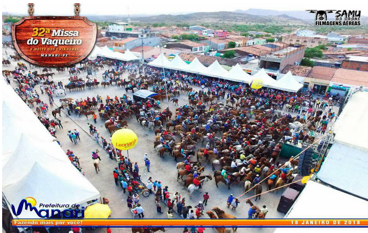
FOTOGRAFIA 13: Vaqueiros acompanham as homenagens e entrega de troféus na Praça de Eventos.