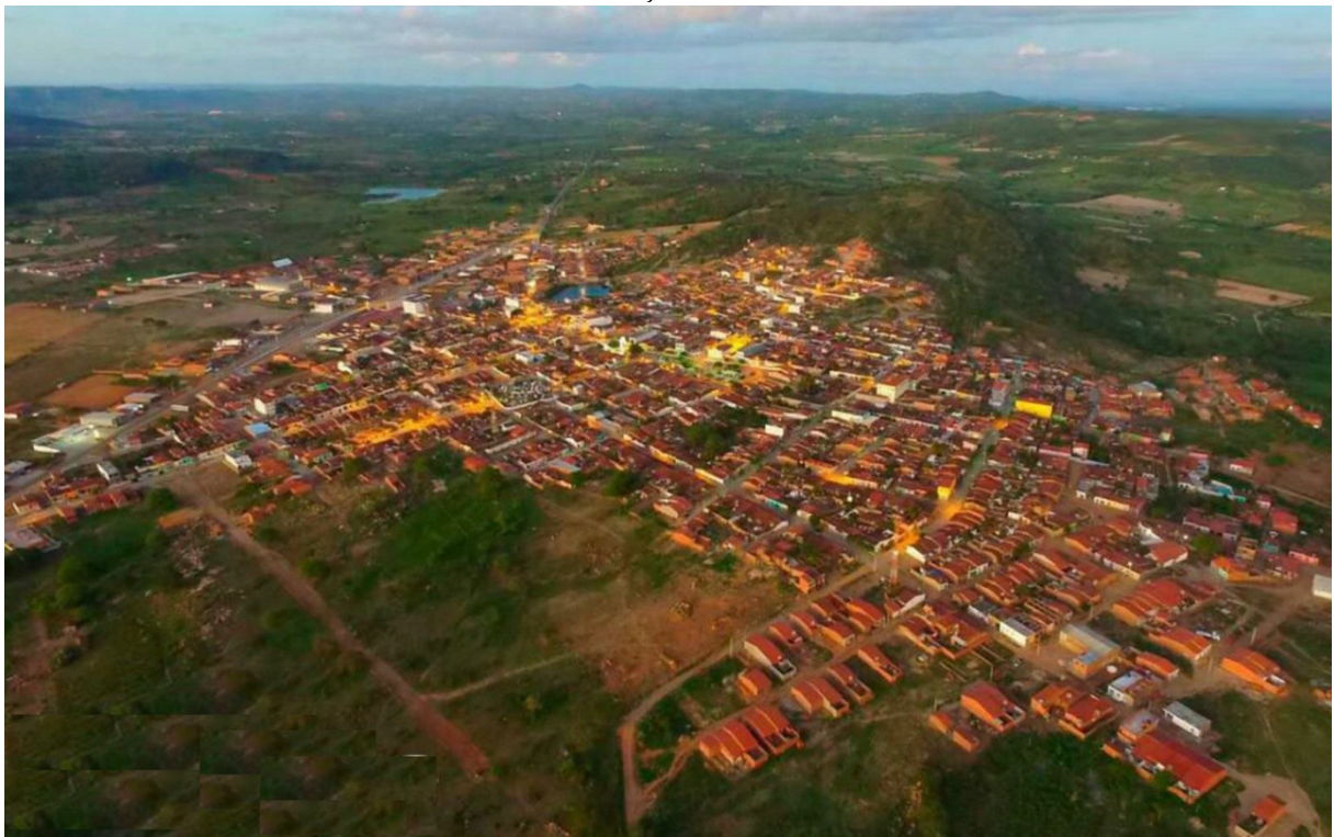
FOTOGRAFIA 02: Vista aérea do traçado urbano do distrito sede. Manari – PE.