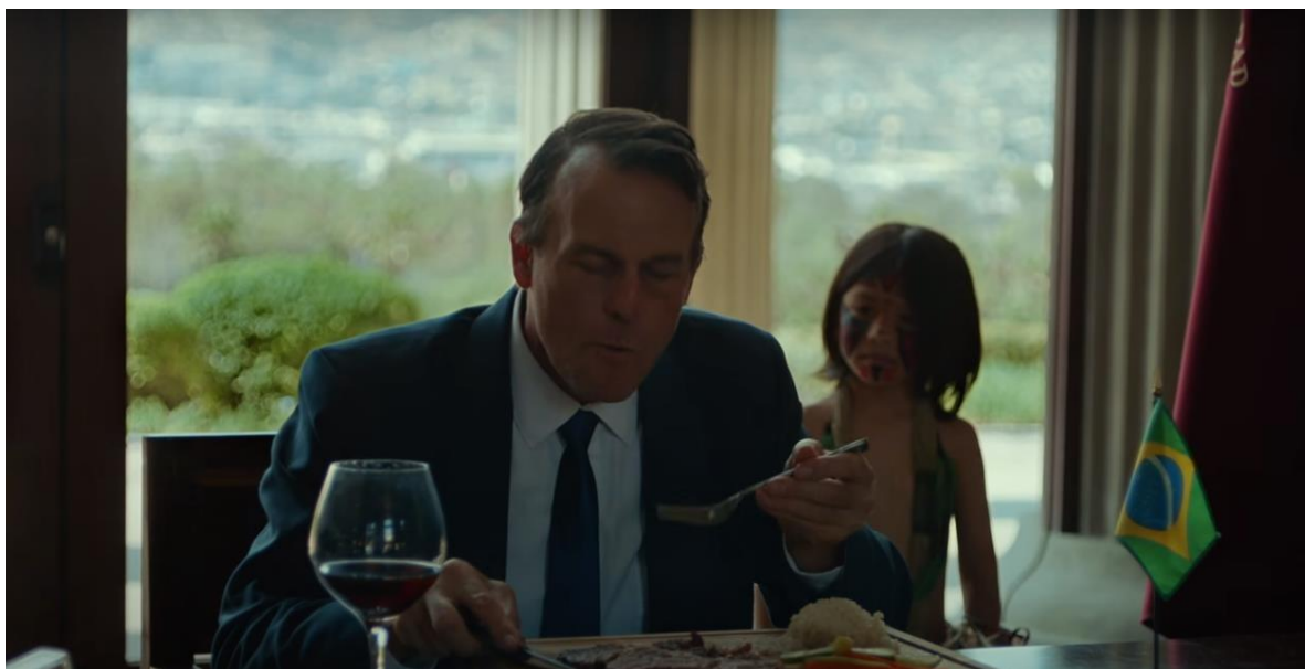
Figura 04 – Referência ao ex-presidente do Brasil, Jair Messias Bolsonaro na canção This is not América do cantor Residente junto a Ibeyi