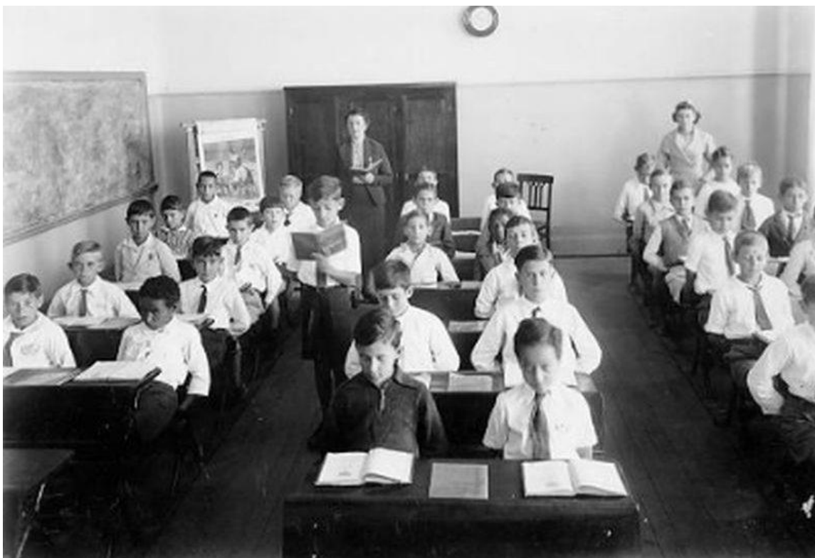
Figura 07 – Aula de leitura da EEPG Orozimbo Maia, de Campinas, em 1939