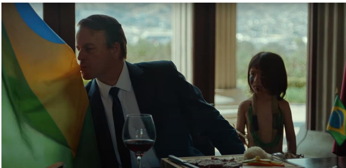
Figura 05 – Referência ao ex-presidente Jair Messias Bolsonaro limpando a boca com a bandeira brasileira