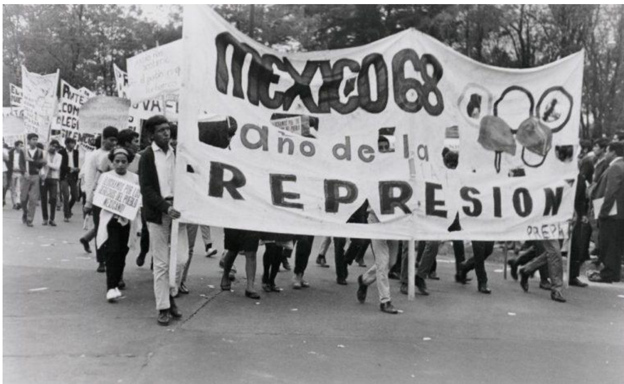
Figura 03 – Protesto de estudantes mexicanos em 1968 após massacre em que a polícia matou centenas de estudantes a tiro

educacionais para suas populações, tudo isso a custo do sangue, trabalho e exploração dos países considerados “subdesenvolvidos” de acordo com a ótica eurocêntrica.