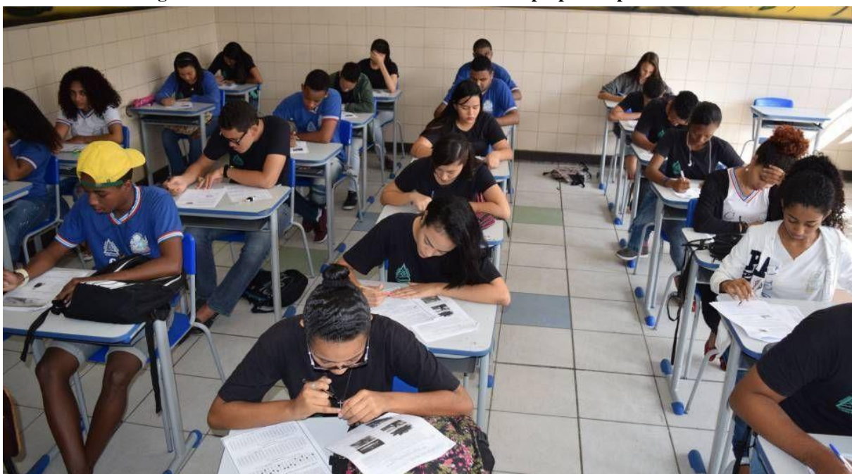
Figura 06 – Alunos da rede estadual da Bahia se preparam para o Enem

O modelo de educação jesuítica ainda segue inspirando o modelo educacional vigente, mesmo com diversas contribuições de teóricos como Paulo Freire, Anísio Teixeira, Darcy Ribeiro, Cecília Meireles, entre outros, o modelo educacional pouco evoluiu nas questões mais burocráticas. A falsidade numerológica quando se trata de avaliações com caráter quantitativo é um dos indicativos que boa parte das abordagens ainda baseadas nas escolas jesuíticas não contemplam a complexidade social e cultural a qual os professores são submetidos. Imagens que fazem comparações de como se dava uma organização em sala de aula antigamente, e nos dias atuais, são bem recorrentes quando se tratam de discussões a nível de comparação.