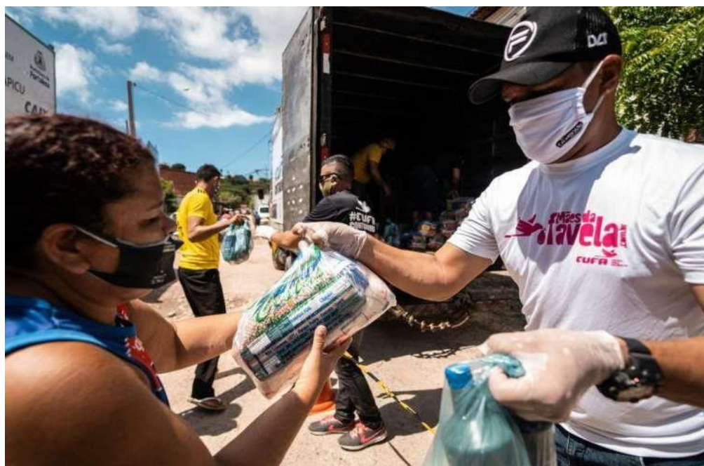
Figura 10 – Distribuição de alimentos durante a Pandemia de Covid-19, em 2021, Cufa-CE

Além desta ação criada durante o período pandêmico, o tradicional “Natal da Cufa” arrecada alimentos e brinquedos no decorrer do mês de dezembro para serem distribuídos para famílias mais necessitadas na semana do natal. O Prêmio Pretos Empreendedores também tem auxiliado iniciativas comerciais surgidas nas favelas desde 2020. Com o agravamento da crise sanitária em decorrência da Covid-19, muitas pessoas viram a necessidade de criarem pequenos negócios para ajudar nas despesas do dia a dia e de casa.