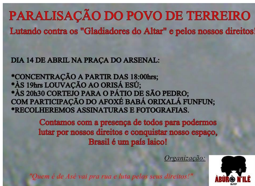
Figura 2 - Cartaz de divulgação da Paralisação do povo de Terreiro, Recife – PE