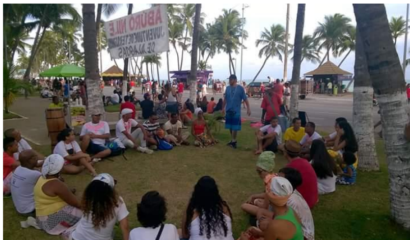
Figura 18 – Encontro Aberto na Orla - Àbúrò N'ílê - Rede de Juventude de Terreiros de Alagoas (25 de janeiro de 2015)

Fonte: Página do Àbúrò N'ílê - RJT-AL no Facebook 245