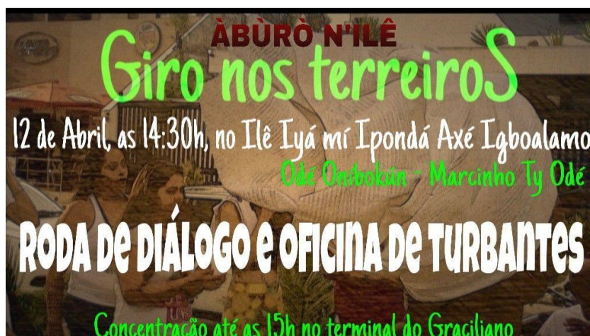
Figura 14 – Cartaz/Divulgação do “Giro nos terreiros” - Àbùrò N'ílê - Rede de Juventude de Terreiros de Alagoas (12 de abril de 2015)

228