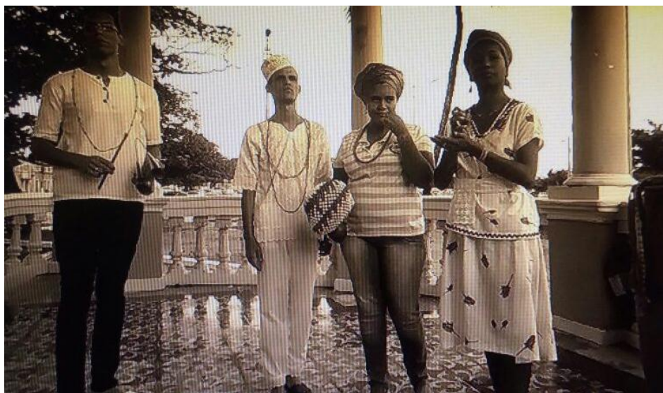
Figura 8 - I Encontro da Juventude de Terreiro “Àbùrò – Alagoas”, Maceió – AL