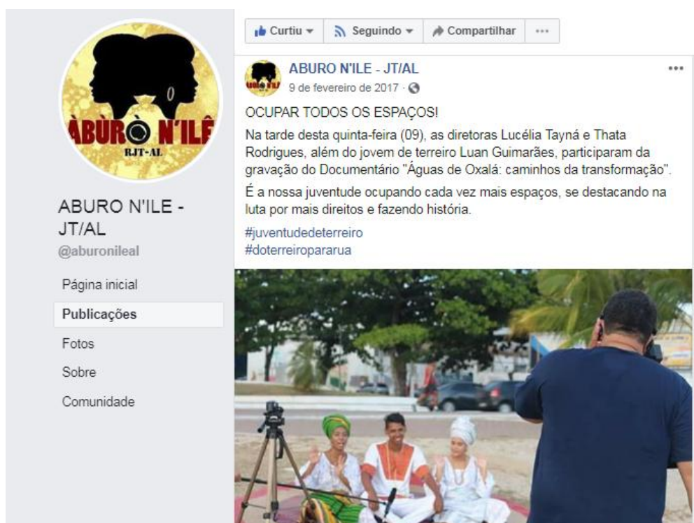
Figura 13 - Foto/registro de atividades do movimento Àbùrò N'ílê - Rede de Juventude de Terreiros de Alagoas (09 de fevereiro de 2017)

199