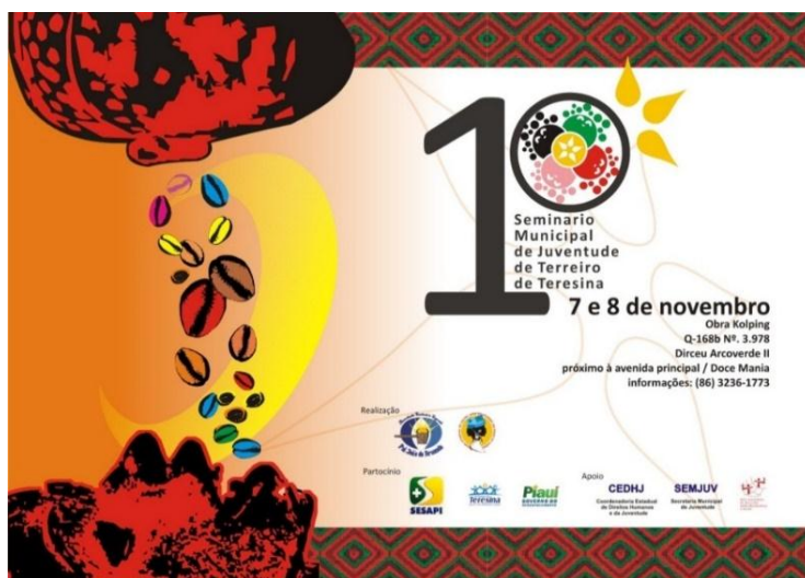
Figura 1 - Cartaz de Divulgação do 1º Seminário Municipal de Juventude de Terreiros de Teresina, Teresina-PI

68