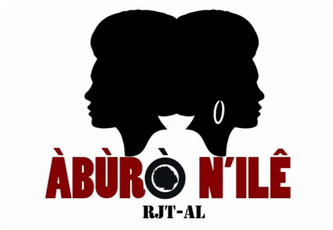
Figura 10 - Logotipo do movimento Àbùrò N'ílê - Rede de Juventude de Terreiros de Alagoas

169