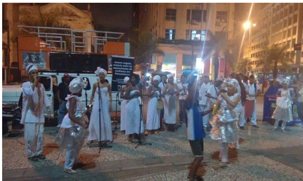
Figura 3 - Paralisação das comunidades de Terreiro, Recife – PE

O cartaz de divulgação acima se trata de uma chamada pública para “A paralisação do povo de terreiro” organizado pela juventude de terreiro que contou com a participação de diversas casas de axé e do grupo cultural Afoxé Babá Orixalá Funfun.