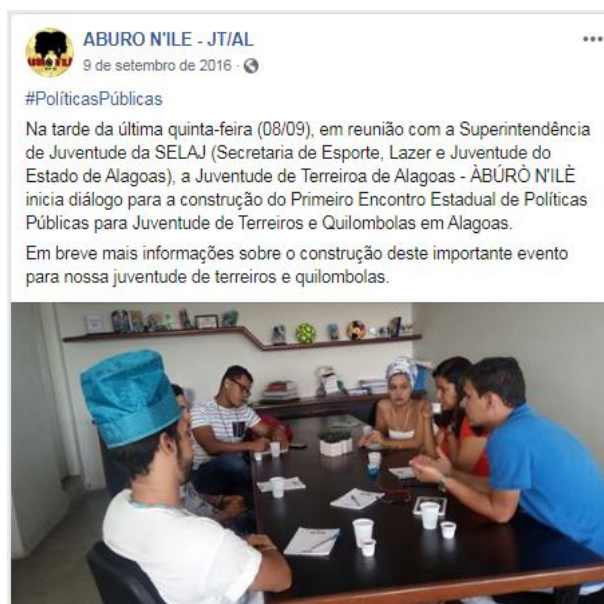
Figura 19 – Reunião para construção de Evento - Àbùrò N’ilê - Rede de Juventude de Terreiros de Alagoas (09 de setembro de 2016)

Fonte: Página do Àbùrò N’ilê - RJT-AL no Facebook 248