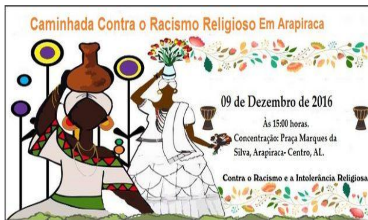
Figura 6 - Divulgação 1ª Caminhada Contra o Racismo Religioso, Arapiraca-AL

A criação, no ano de 2006, da Rede de Terreiros de Alagoas, em conjunto com a Secretaria da Mulher, da Cidadania e dos Direitos Humanos do Estado de Alagoas (SMCDH/AL) e, posteriormente, com Articulação pela Cultura Popular e Afro Alagoana (2009); tem articulado líderes religiosos, grupos culturais e sociedade civil para construção e execução de um calendário de atividades. Neste contexto, é importante mencionar outro momento que tem ganhado notoriedade: “A Caminhada de Terreiros contra o Racismo Religioso” que ocorre em Arapiraca entre os meses de novembro e dezembro, desde o ano de 2016.