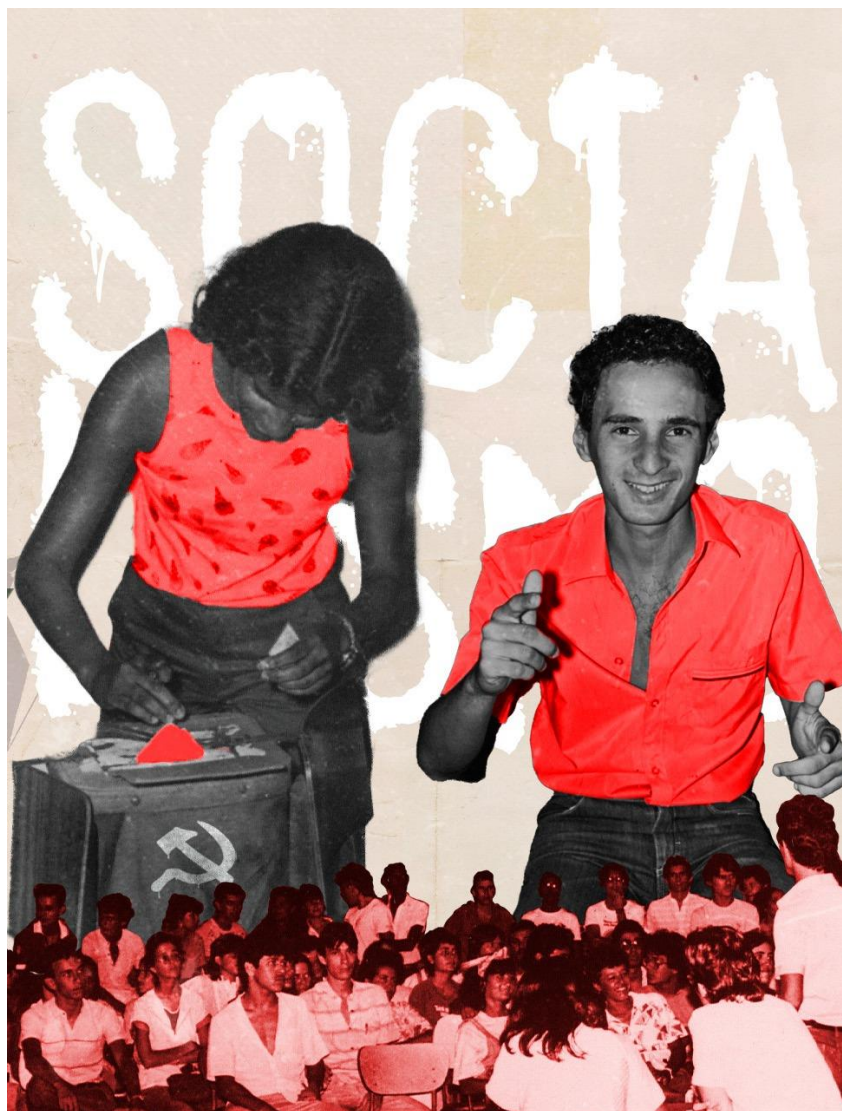
Fonte: Paulo Araújo (2024), colagem com fotografias do acervo do CPDHis, registros do Movimento Estudantil, anos 1980.