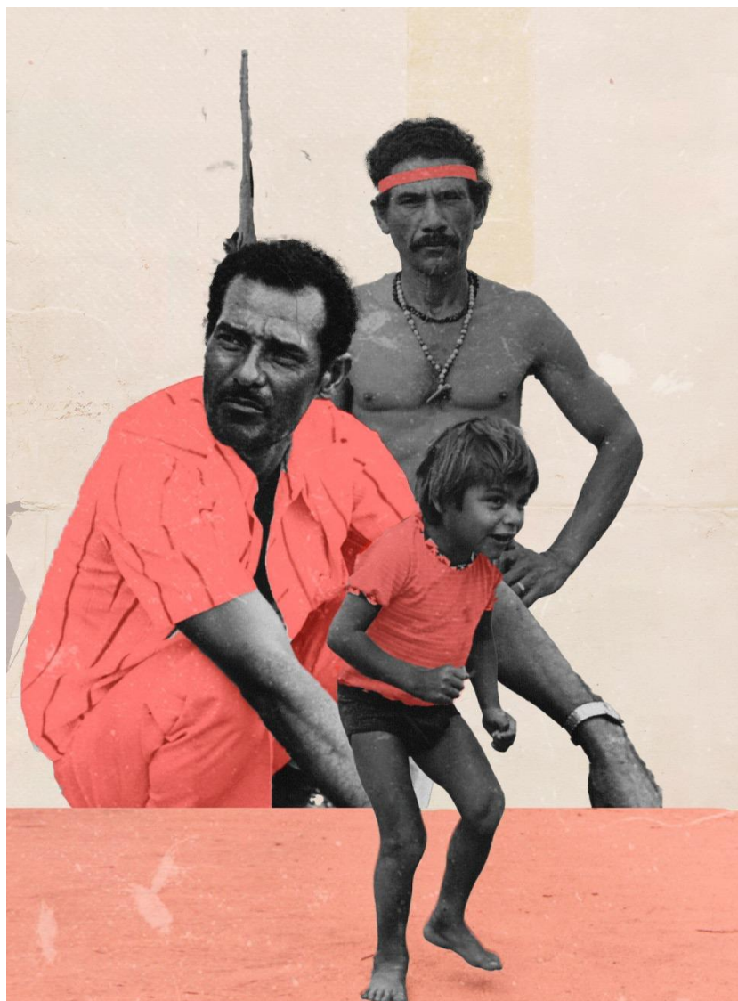
Fonte: Paulo Araújo (2024), colagem com fotografias do acervo do CPDHis, Movimento Indígena, Alagoas, c. 1980.