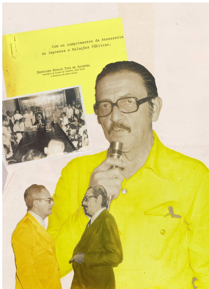
registros da trajetória de Teotônio Vilela, anos 1970-1980.